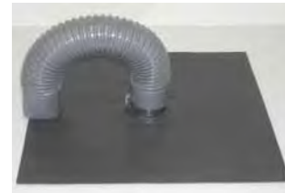
※写真はヨコ型 70 用です